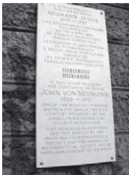
1987. február 8. óta ez az emléktábla jelöli a szülőházat