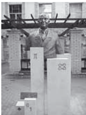
Neumann János Számítógép-tudományi Társaság (NJSZT)

1997-ben jött létre a Neumann János Digitális Könyvtár és Multimédia Központ Kht. (Neumann-ház). Az intézményt a Nemzeti Kulturális Örökség Minisztériuma alapította, azzal a céllal, hogy részt vegyen a magyar kulturális örökség digitalizálásában, és az internet segítségével elérhetővé tegye a műveket itthon és külföldön egyaránt.