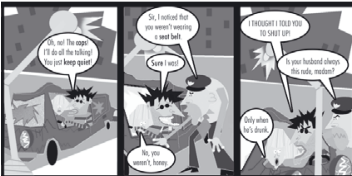
a cop n a police officer / to keep quiet exp not to talk / a seat belt n a belt that you use in a car for safety / sure exp yes, of course