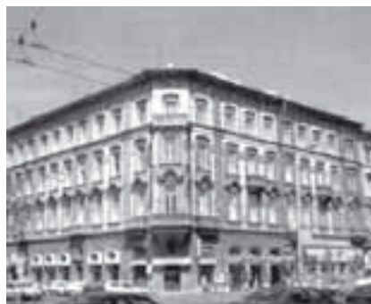
Bajcsy-Zsilinszky út 62. Neumann János szülőháza