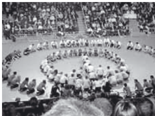
Szalagavató bál, 2004