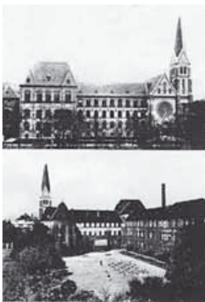
Fasori Evangélikus Gimnázium

A két tudós a Budapesti Fasori Gimnáziumban találkozott először.