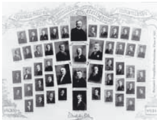
Neumann János tablója

Úgy havonta egyszer Jancsival mentem haza az iskolából. Lebilincsel, milyen magas fokon tudja a matematikát, milyen káprázatosan ma-