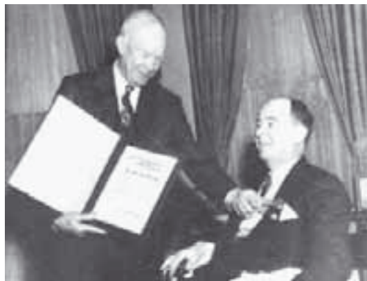
Neumann János átveszi Eisenhower elnöktől az egyik legnagyobb amerikai kitüntetést, a Medal of Freedomot