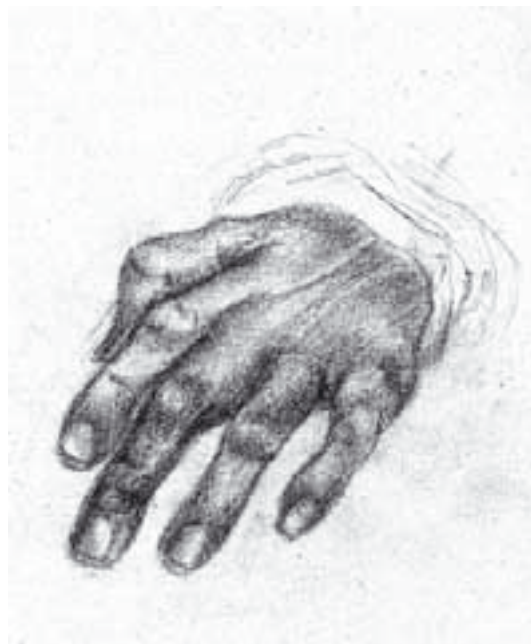
Kerekes Zsófia: Kéztanulmány