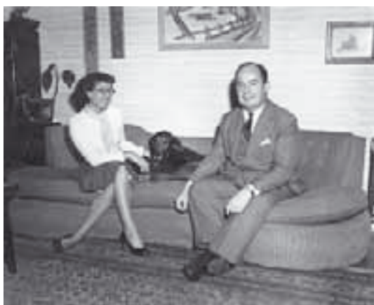
Neumann János feleségével és kutyájával

lyet tisztelői kedvesen JONNIAC-nak is neveztek. Érdemeinek elismeréseképpen az Amerikai Egyesült Államok elnöke kinevezte az USA Atomenergetikai Bizottságának elnökévé. Ennek az öttagú bizottságnak tagjaként megkapta az akkori legmagasabb szintű kormány megbízatást, amit egy tudós kaphatott.